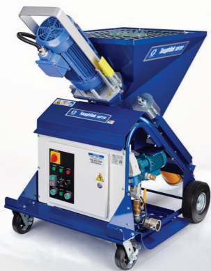
BOMBA DE ESTATOR/ROTOR

Con su capacidad de mezclado y bombeo, esta máquina compacta todo en uno es la solución ideal para los contratistas que buscan hacer el cambio desde la aplicación manual de contrapiso autonivelante. La bomba MP20 puede suministrar hasta 100 bolsas por hora, lo que permite a los contratistas hacer los trabajos de manera más rápida.