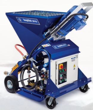
BOMBA DE ESTATOR/ROTOR

Aunque es idéntica en tamaño y función que la bomba MP20, la MP40 tiene el doble de salida y puede bombear hasta 200 bolsas por hora de contrapiso autonivelante. El motor y la bomba más grandes hacen que la bomba MP40 sea una excelente opción para los contratistas que buscan una solución de alta producción.