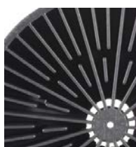
200 l (55 galonów)