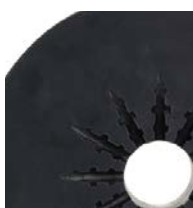
20 l (5 galonów)