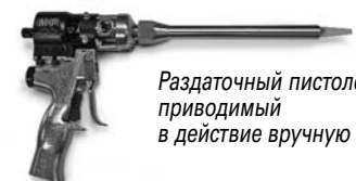
Раздаточный пистолет, приводимый в действие вручную