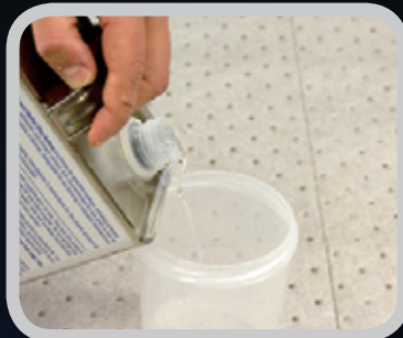
2. カップに水または洗浄液を注ぎます。