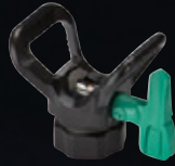
トウルコート・プロエックス ファインフィニッシュ 塗料およびチップサイズ

好みのパターン幅で様々な精密仕上げに対応できるよう、多様なファインフィニッシュ・チップを取り揃えております。