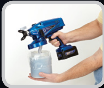
2. カップをスプレーヤーに取り付けます。