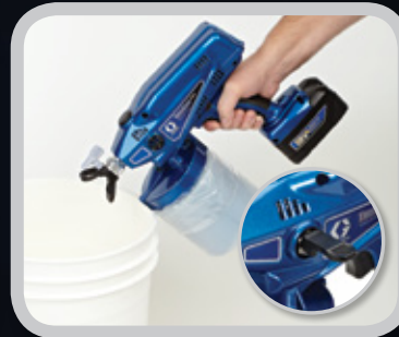
3. スプレーヤーをプライムします。

洗浄が簡単な使い捨てカップライナーです。ライナーをカップから外して捨てます。カップに水または洗浄液を注ぎ、ポンプ内で循環させて流せば、次の作業に取り掛かることができます。