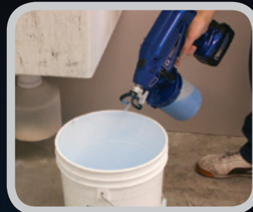
3. チップを逆にして勢いよく流します。