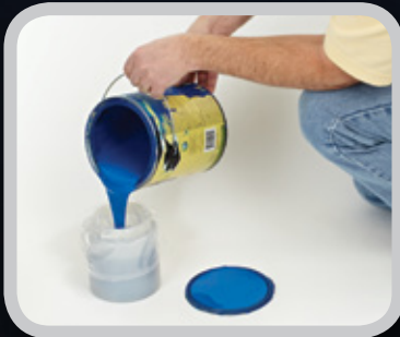
1. 塗料をカップに注ぎます。