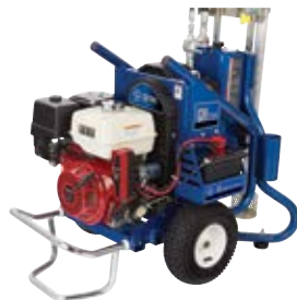
卡车和拖车的理想之选！