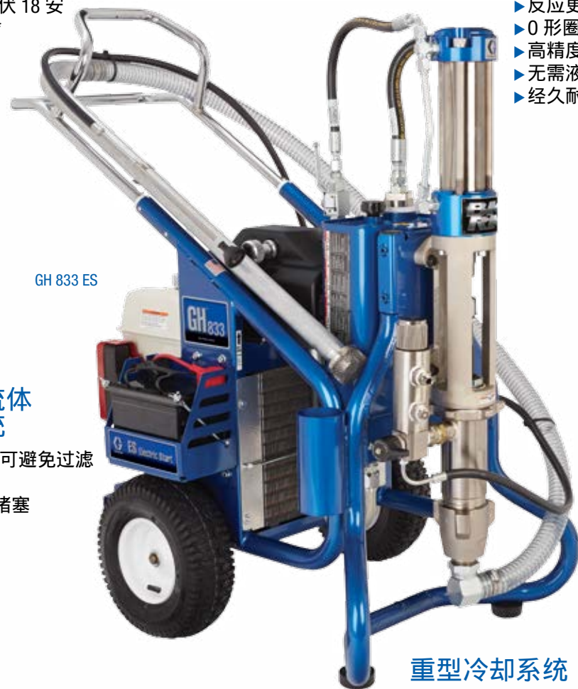
GH 833 ES