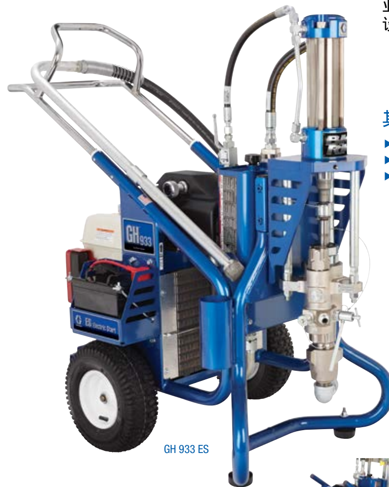
GH 933 ES

30 年来，GH 系列的汽油动力液压喷涂设备给承包商带来了最大的性能和无可匹敌的多功能性。如今，全新 GH Big Rig 喷涂设备系列延续着这一传统。每个 Big Rig 喷涂设备均配备独有的 QuikChange™ 下缸体，可针对各种涂料轻松定制，而无需重复购买整机。无论是需要高压来处理长管输送需求和难以雾化的材料，还是需要大流量来喷涂超厚的涂层，GH Big Rig 喷涂设备都能出色地完成工作！