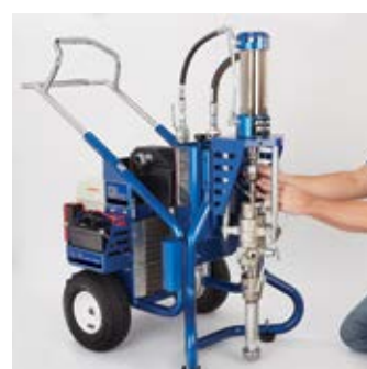
可互换的泵提供适各类应用的最大弹性。