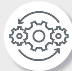
メンテナンスの 簡素化