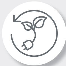
持続可能な オペレーション

QUANTMは、高価だったり難解だったり、ユーザーの負担になるような製品ではありません。スマートでシンプル、費用対効果が高く、クリーンで、環境に配慮したものです。QUANTMは、より軽く静かで、信頼性が高く、ユーザーの誰もが簡単にメンテナンスできるように設計されています。QUANTMの導入は単なる設備投資ではありません。変化し続ける未来への大きな一歩なのです。