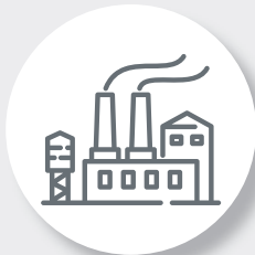
オペレーションの 強靭化