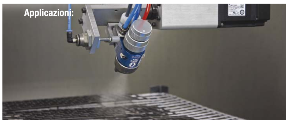
Applicazione automatica pneumatica pistola a spruzzo automatica AirPro EFX™ di Graco.