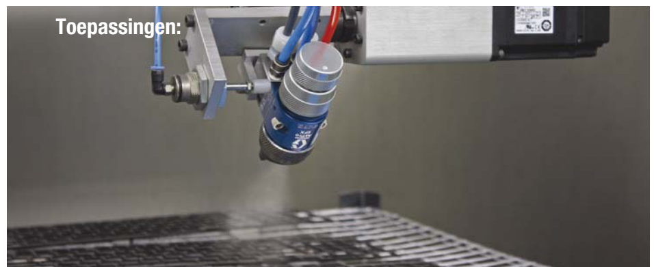
Graco's geautomatiseerde luchtgestuurde toepassing op basis van het AirPro EFX™ automatische spuitpistool.