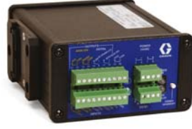
Graco ACS Modülü