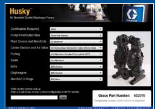
Exemplo de ferramenta de seleção de produtos

Para encomendar uma bomba Husky 3300, acesse www.graco.com/husky para usar a ferramenta de seleção ou contate o seu distribuidor.