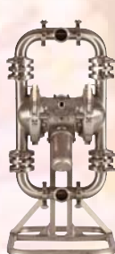
SaniForce 1590 HS 50.8 мм