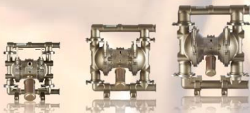
SaniForce 1040 38 мм