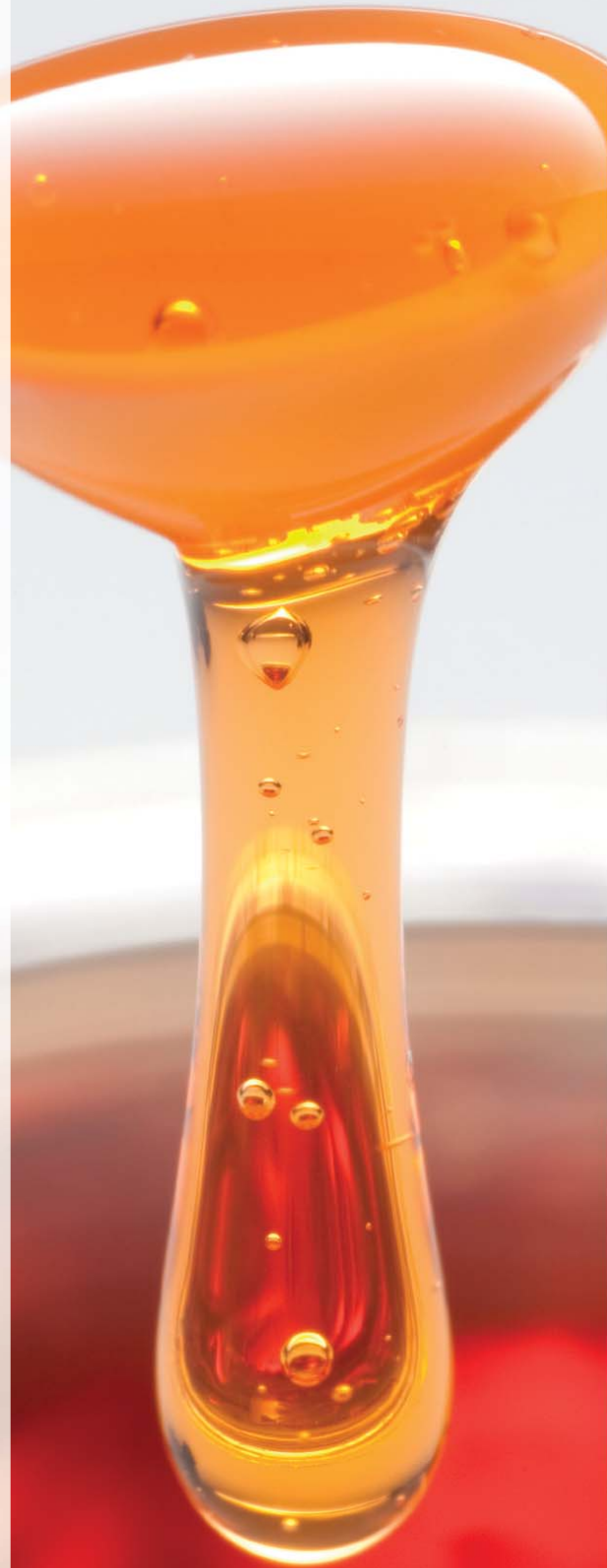
SaniForce 3150 HS 76 mm (3 in)