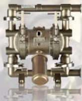
SaniForce 1040 38 mm (1,5 in)

FD3113 SaniForce 2150: conexión con brida de 63,5 mm (2,5 in) Asientos de acero inoxidable, bolas y diafragmas sobremoldeados de PTFE Caudal máximo: 567 l/min (150 gpm)