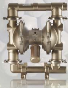
SaniForce 2150 63,5 mm (2,5 in)