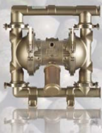
SaniForce 1590 50,8 mm (2 in)