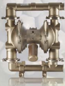
SaniForce 2150 63,5 mm (2,5 in)