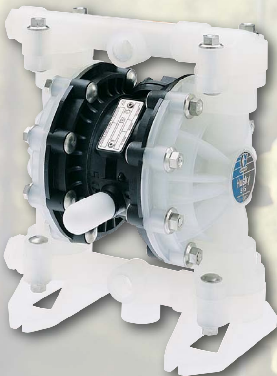
Husky 515, Polipropilene 12,7 mm (1/2 in)

D52966 Husky 515 in polipropilene, sedi in polipropilene con dimensioni connessione 12,7 mm (1/2 in), sfere e membrane in santoprene Portata massima 56 l/min (15 gpm)