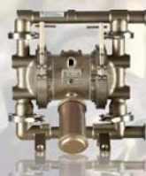
SaniForce 1040 38 mm (1,5 in)

FD3113 SaniForce 2150 - collegamento flangia da 63,5 mm (2,5 in) Sedi in INOX, sfere e membrane sagomate in PTFE Flusso massimo 567 l/min (150 gpm)