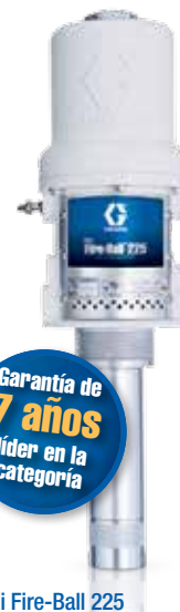
Mini Fire-Ball 225