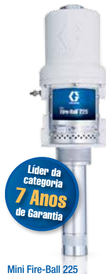
Mini Fire-Ball 225