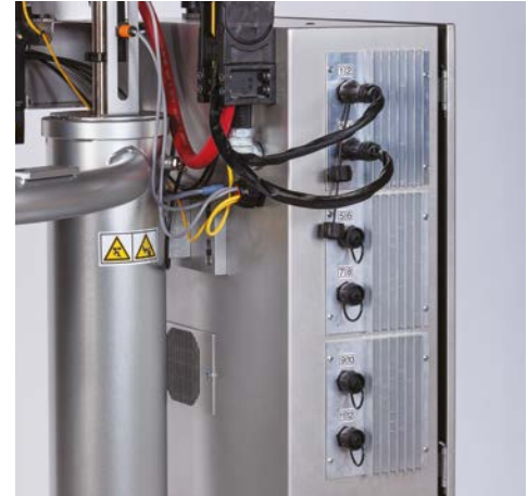
Sechs Anschlusspunkte für die zwölf kundendefinierten Heizzonen

Graco bietet ein umfassendes Angebot an Therm-O-Flow-Heißschmelzsystemen und „point of use“ Schmelzsystemen, die alle entsprechend Ihrer spezifischen Anwendung konfiguriert werden können.