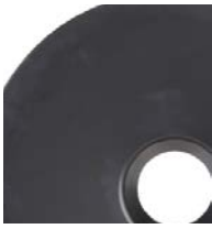
200 l (55 gal)