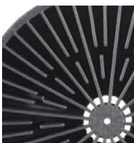
200 l (55 gal)