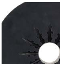
20 l (5 gal)