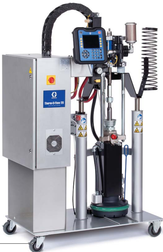
Therm-O-Flow 20 (5 gal)