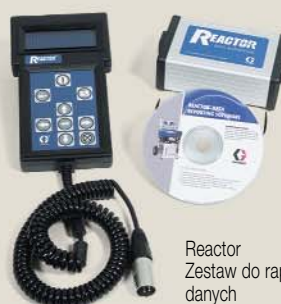
Reactor Zestaw do raportowania danych