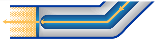
先进先出式 (FIFO) 流体通道