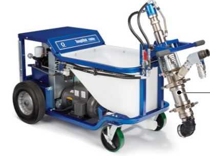
Döner Pompa Alt Grubu