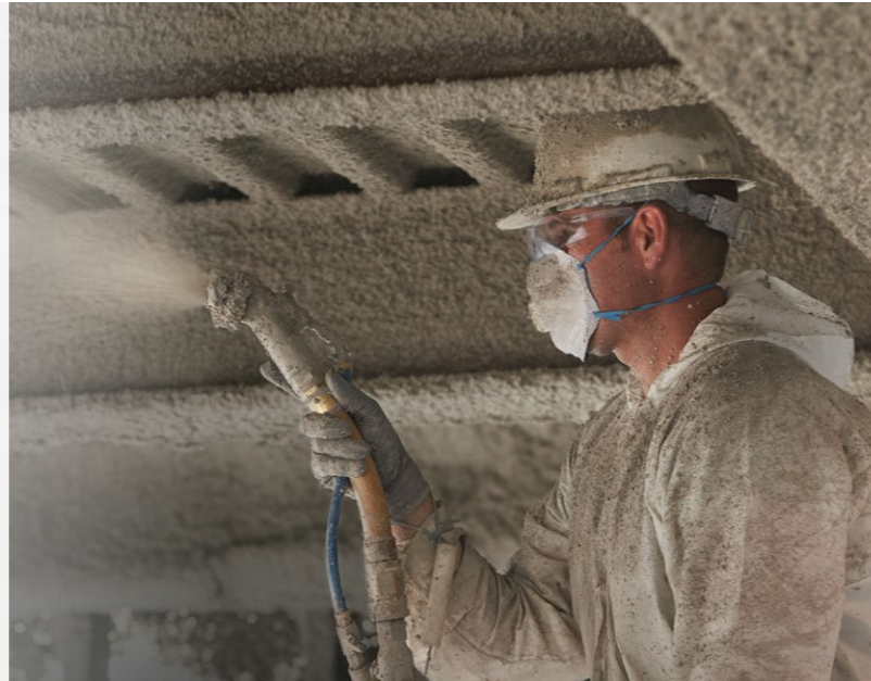
ToughTek F680e Yangına Dayanıklı Malzeme Pompası