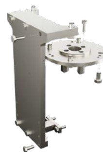
Монтажный кронштейн и кронштейн, препятствующий вращению, для установки робота