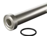
Комплект сопла с уплотнительным кольцом

Все клапаны поставляются с соплом 6 x 8 мм (0,23 x 0,32 дюйма)