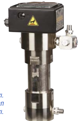
Harici kontrollü Viscon HF ısıtıcı. Gösterilen: patlayıcı olmayan atmosfer ısıtıcı.