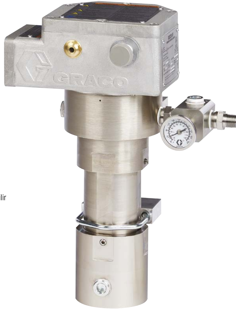
Eksiksiz Viscon HF ısıtıcı manuel termostat kontrollüdür. Gösterilen: patlayıcı atmosfer ısıtıcı.