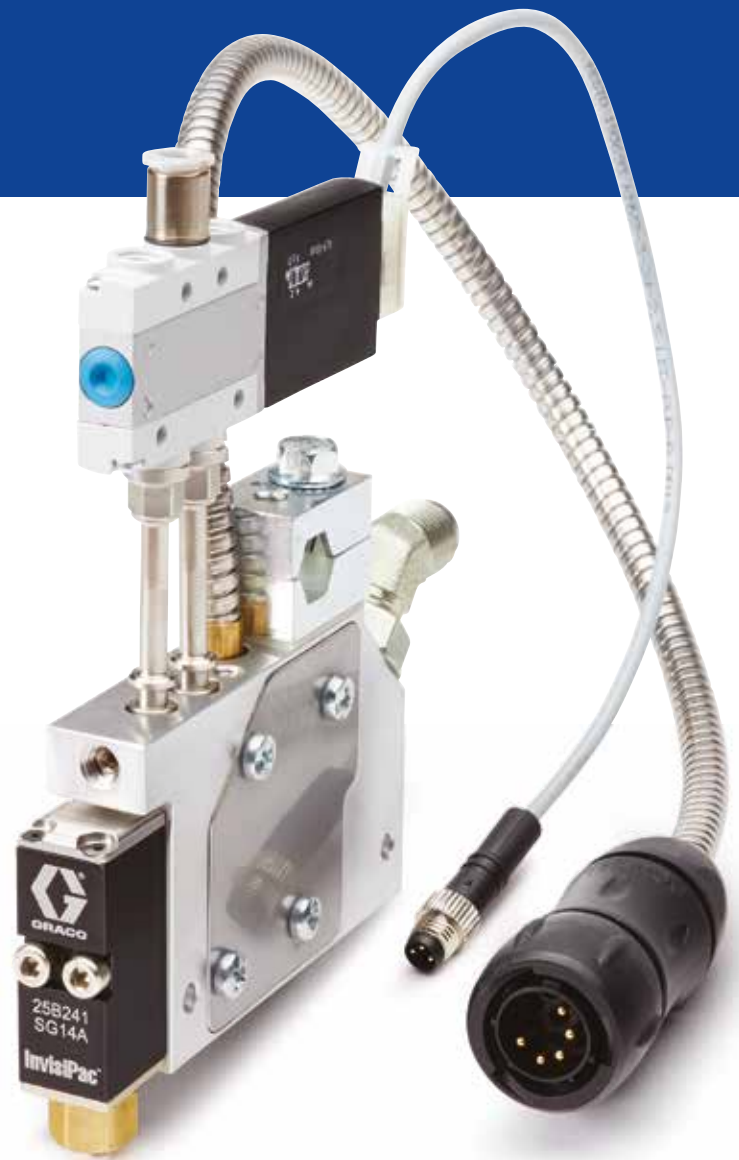
Andere Konfigurationen verfügbar; alle UL499-zugelassen