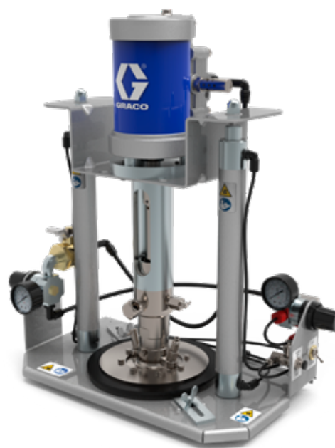
DynaMite 190 供料泵