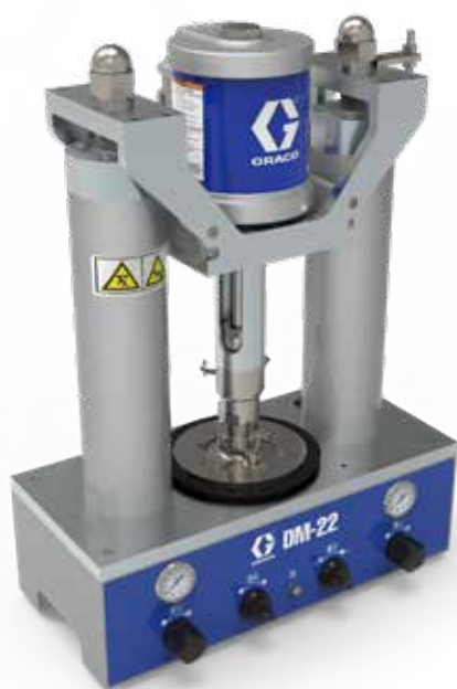
DynaMite 22 供料泵