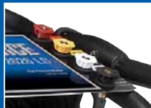
颜色标识可确保快速精确的喷嘴选择