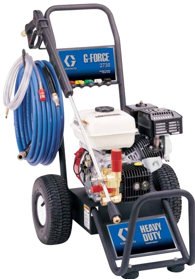
G-Force 2730 H