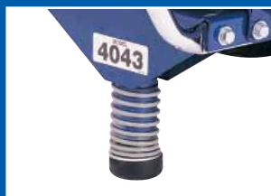
弹簧支承隔离支架