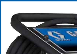
双向把手兼作软管包封之用