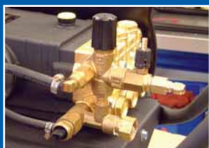
含EZ起动机阀的通用机泵