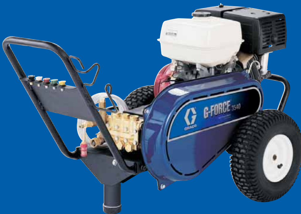
G-Force 3540 BD