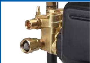
含有热防护功能的径向轴流式水泵

二种型号均包含: 30 ft (9.1 m)无痕高压软管,喷枪和喷枪杆,4种喷嘴(0°, 15°, 40°和化学喷嘴)和4 ft (1.2 m)化学药剂管道。