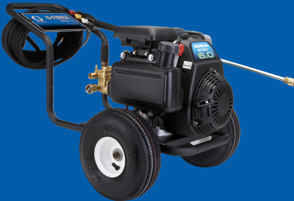
G-Force 2626 LD