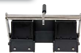
4 in x 4 in x 4 in SmartDie II

Szeroki wybór aplikatorów umożliwia nakładanie linii ciągłej (5–30 cm), przerywanej lub podwójnej za pomocą specjalnej matrycy. Korzystając z szablonu, można malować napisy, znaki „stop” i znaki ostrzegawcze.