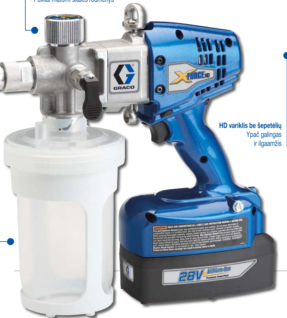
HD variklis be šepetėlių Ypač galingas ir ilgaamžis