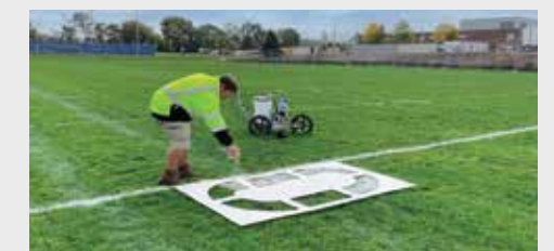
Extracción de pistola sin herramientas para plantillas de rociado o áreas sólidas y grandes.