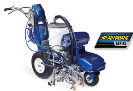
LINELAZER V ES 2000 SERIE HP AUTOMATIC