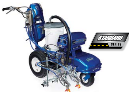
LINELAZER V ES 2000 SERIE STANDARD