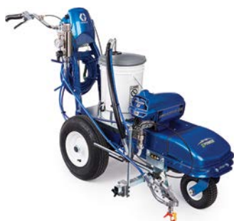
LINELAZER ES 1000