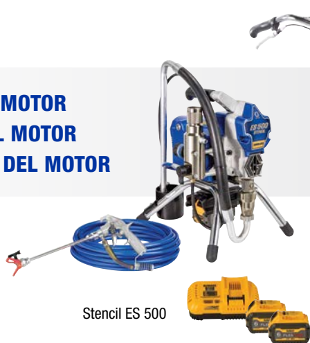
Stencil ES 500

SIN RUIDO DEL MOTOR SIN HUMOS DEL MOTOR SIN VIBRACIÓN DEL MOTOR