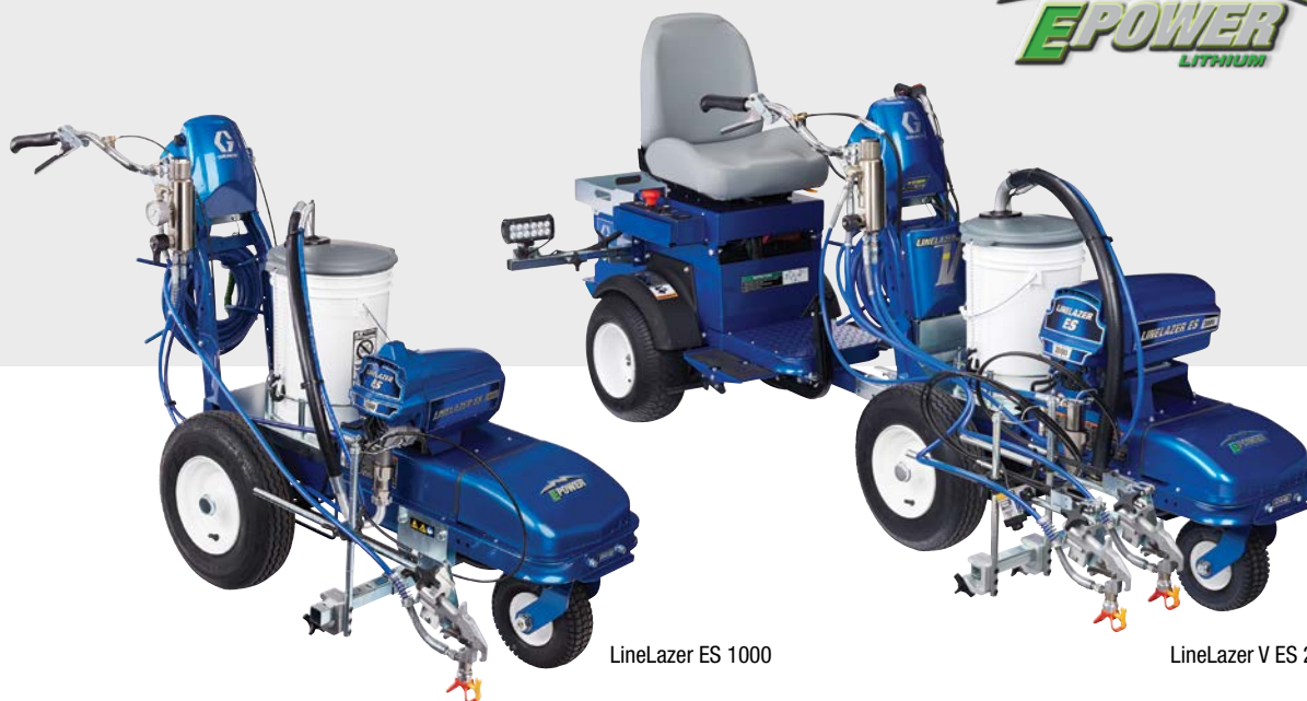
LineLazer ES 1000