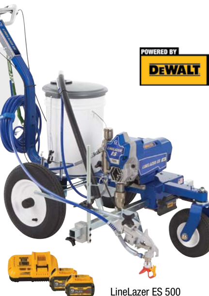
LineLazer ES 500