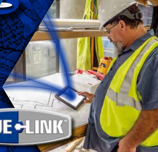
经理可以了解作业进度