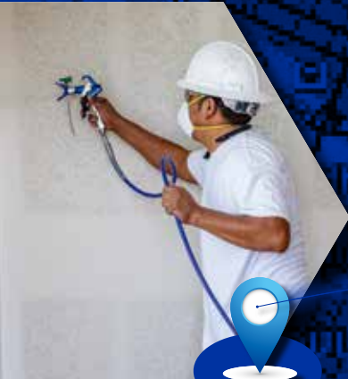
喷涂人员可尽量 延长运行时间