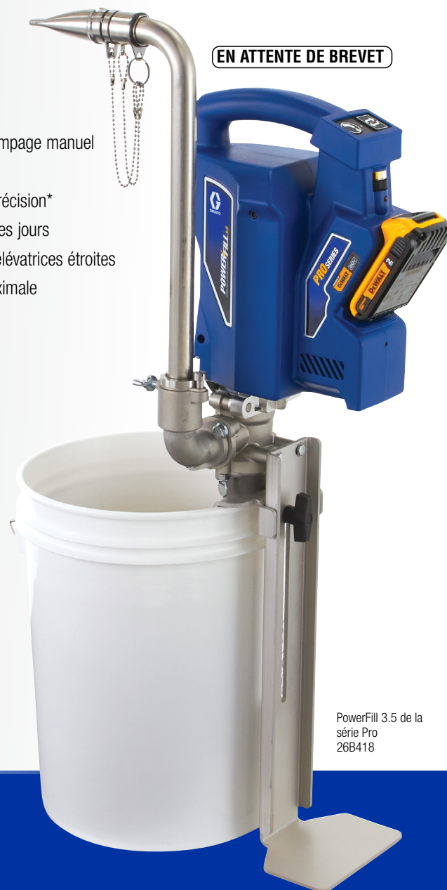
PowerFill 3.5 de la série Pro 26B418