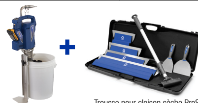
Trousse pour cloison sèche ProSurface (18C676) montré sur la photo

Pour plus de renseignements, consultez le site Web graco.com/ProSurface