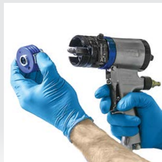
Drücken Sie die neue PC Materialpatrone auf die Mischkammer