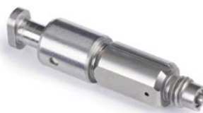
Camera di miscelazione piatta