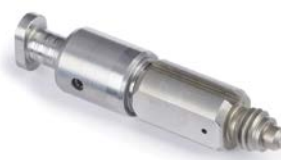
Camera di miscelazione tonda