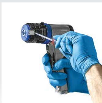
Verwijder het patroon