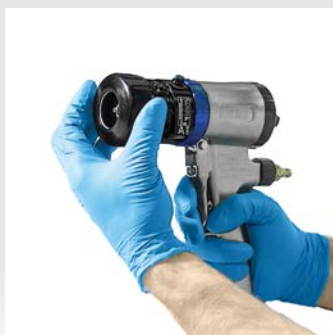
Verwijder de luchtkap en de borgring

Een Fusion ProConnect-patroon verwijderen en vervangen: