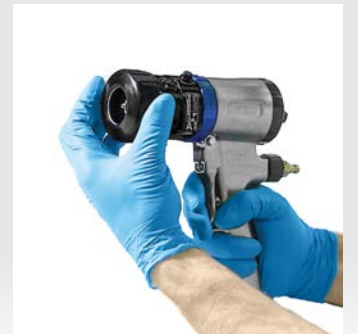
Tutma halkasını ve hava başlığını takın