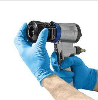
Hava başlığını ve tutma halkasını çıkarın

Bir Fusion ProConnect kartuşunun çıkarılması ve değiştirilmesi: