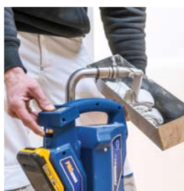
Bandeja para masas