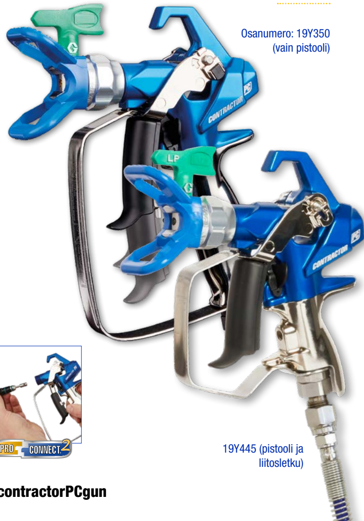
Osanumero: 19Y350 (vain puistooli)