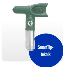
Det gröna LP-munstycket