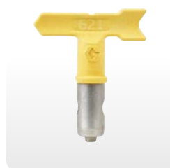
Det gula munstycket

För målning inomhus och utomhus samt mycket tungt material, inklusive putsfärg