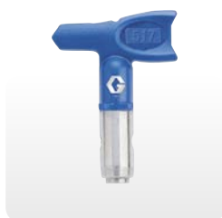
Det blå PAA-munstycket

FFLP för finlackering, LP för väggar, innertak och golv