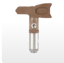
Det bruna HDA-munstycket

För projekt inomhus och utomhus samt kommersiell och industriell användning