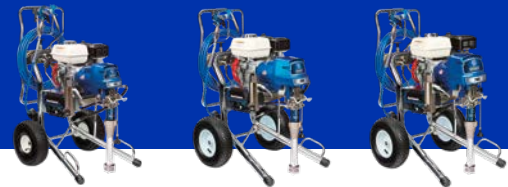
GMAX II ProContractor 3900 5900 (5900 HD) 7900 (7900 HD)