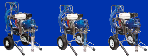
GMAX II (HD 3-IN-1) ProContractor