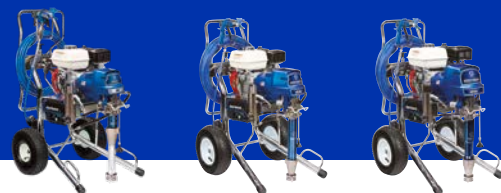
GMAX II (HD 3-IN-1) ProContractor