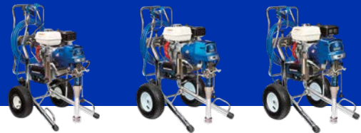
GMAX II ProContractor 3900 5900 (5900 HD) 7900 (7900 HD)