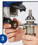
3 Irrota letku ja imuputki