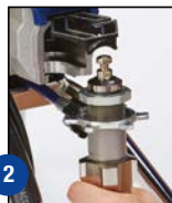
2 Avaa luukku ja irrota pumppu