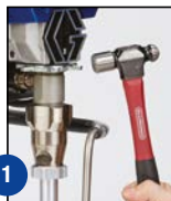
1 Lazítsa meg a szorítóanyát

Nincs több elvesztegetett idő, és nem kell pénzt költenie a szivattyújavítás munkadíjára.