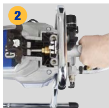
2 Извлеките насос