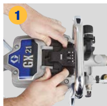
1 Сдвиньте и откройте дверцу, потянув ее вверху