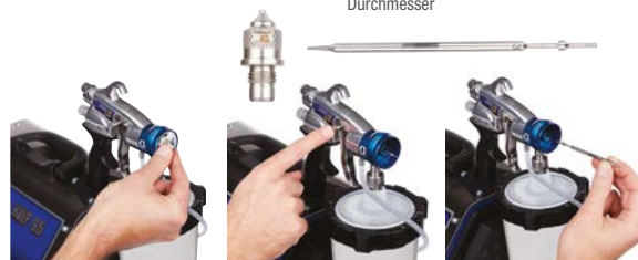
1. Entfernen Sie die Luftkappe und die Düse.