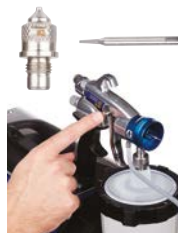
2. Deslice la palanca del gatillo para soltar la aguja.