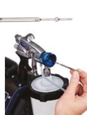
3. Extraiga la aguja.