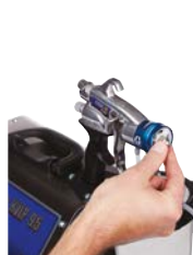
1. Retire la boquilla y el cabezal de aire de la parte delantera.