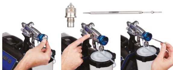
1. Rimuovere il cappello dell'aria e l'ugello.