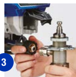
3 Irrota letku ja imuputki